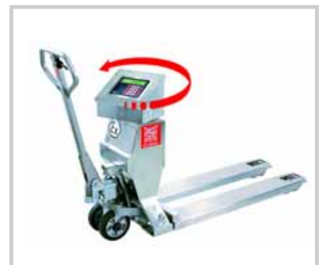
ROBUSTO COMFORT EX SL/VL