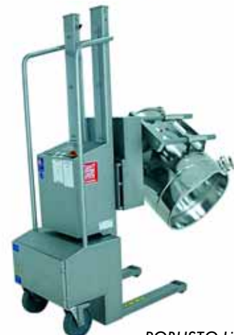
ROBUSTO Lifter FL 120