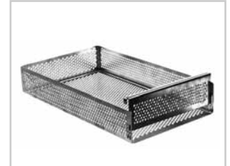
Ampullen-Kassette mit Schieber