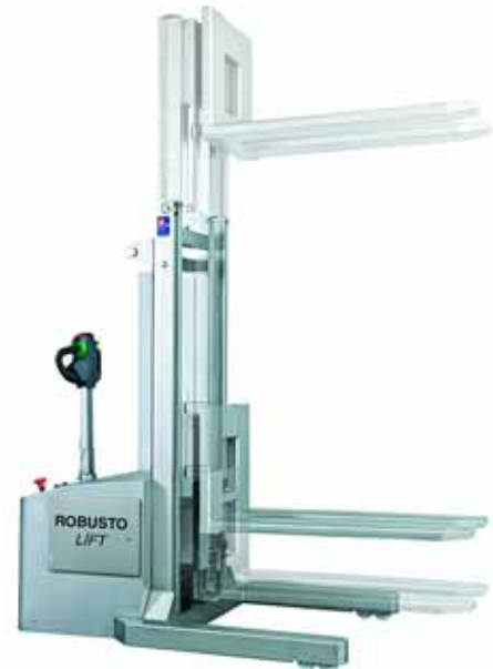
ROBUSTO LIFT 400/600