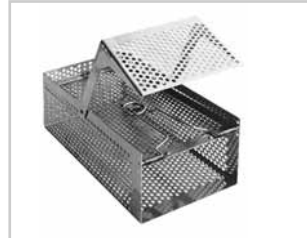
Ampullen-Kassette mit Klappe