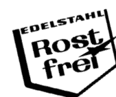
Edelstahl mit Eckfüßen Palettendeck mit 7 Quersprossen und 4 Eckfüßen Weitere Ausführungen auf Anfrage!