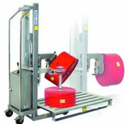
ROBUSTO Reflex 125 V