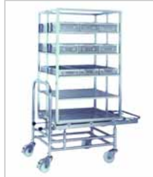
Hordenwagen mit Autoklaviersystem