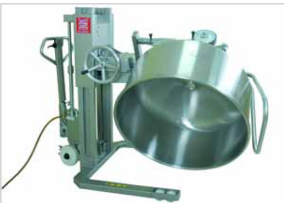
Sonderlifter pneumatisch, mit manueller, seitlicher Kippvorrichtung und 2 Aufnahmedornen