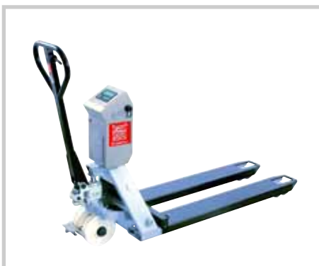
ROBUSTO PRIMA SL/VL