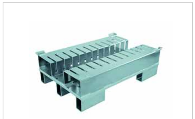
Aluminiumpalette für Formringe