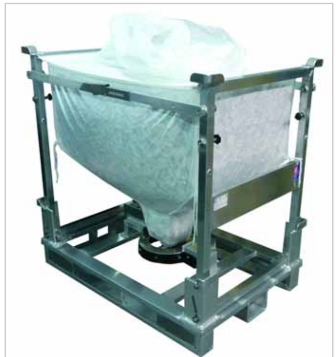
MBF zusammenklappbare Ausführung