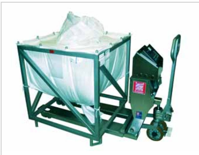
MBF starre Ausführung

Selbstverständlich GMP- und Arbeitsschutzgerecht (BGR 234) und wie immer durch das spezielle SCHNEIDER Hygiene Design für den Reinraum bestens geeignet.