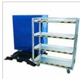
Mobiles variables Transportsystem