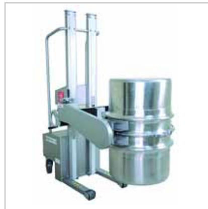
Rhönrad-Lifter, spezielles schmales Greif- system