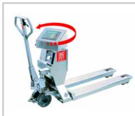
ROBUSTO COMFORT SL/VL