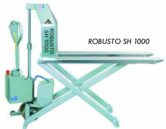
ROBUSTO SH 1000