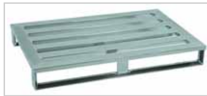
Aluminiumpalette Typ 816R Palettendeck mit 4 Längssprossen, leichte Kufenausführung