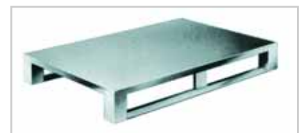
Aluminium Volldeckpalette – die superhygienische Typ 512 Palettendeck oben und unten geschlossen, mit Längskufen