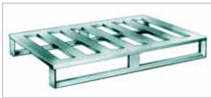
Aluminiumpalette – der Klassiker Typ 816 Palettendeck mit 5 Quersprossen, leichte Kufenausführung