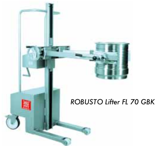
ROBUSTO Lifter FL 70 GBK