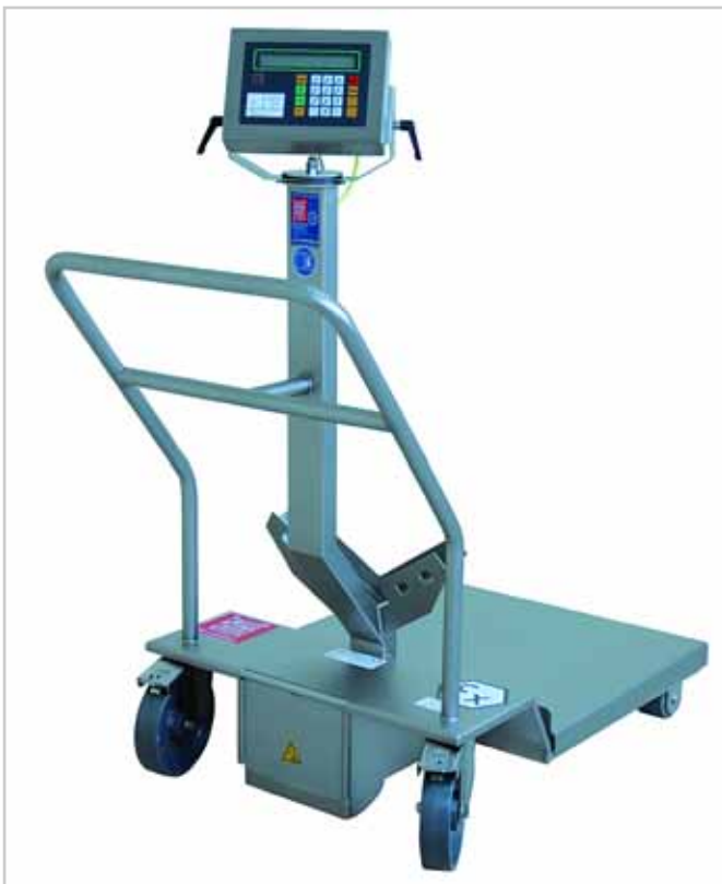
ROBUSTO MW 300 EX