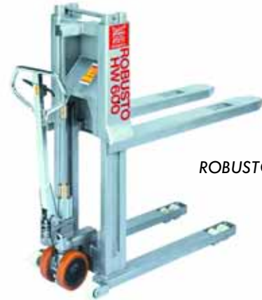
ROBUSTO HHW 600