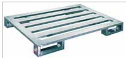
Aluminiumpalette mit Kurzkufe Palettendeck mit 4 Längssprossen und 4 Kurzkufen 300 mm lang