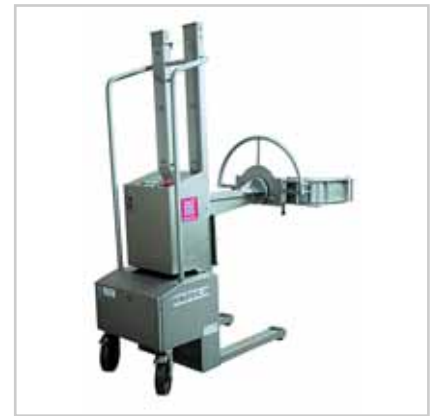
Beschicker von Waschmaschinen