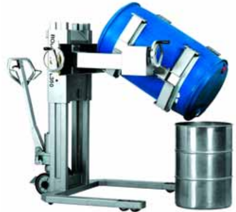
ROBUSTO FL 350 GBK