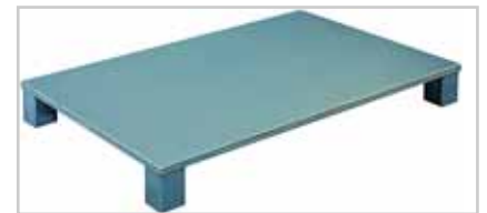
Aluminium Volldeckpalette Typ 520 Palettendeck oben und unten geschlossen, mit Eckfüßen