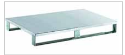
Aluminium Volldeckpalette Typ 816 Palettendeck oben und unten geschlossen, mit Längskufen