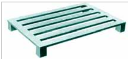
Aluminium 4-Wege Palette Typ 520 Palettendeck mit 4 Längssprossen und 4 Eckfüßen

Als innovativer Hersteller bietet SCHNEIDER LEICHTBAU ein breit gefächertes Sortiment an Flachpaletten für alle denkbaren Einsatzbereiche an – natürlich auch mit der AluClean® Oberfläche: