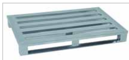
Aluminiumpalette – das Schwergewicht Typ 512R Palettendeck mit 4 Längssprossen, schwere Kufenausführung