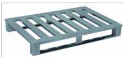
Aluminiumpalette – das Schwergewicht Typ 512 Palettendeck mit 6 Quersprossen, schwere Kufenausführung