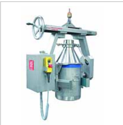
Fassgreifsystem mit elektrischem Kipp- antrieb für Kraneinsatz